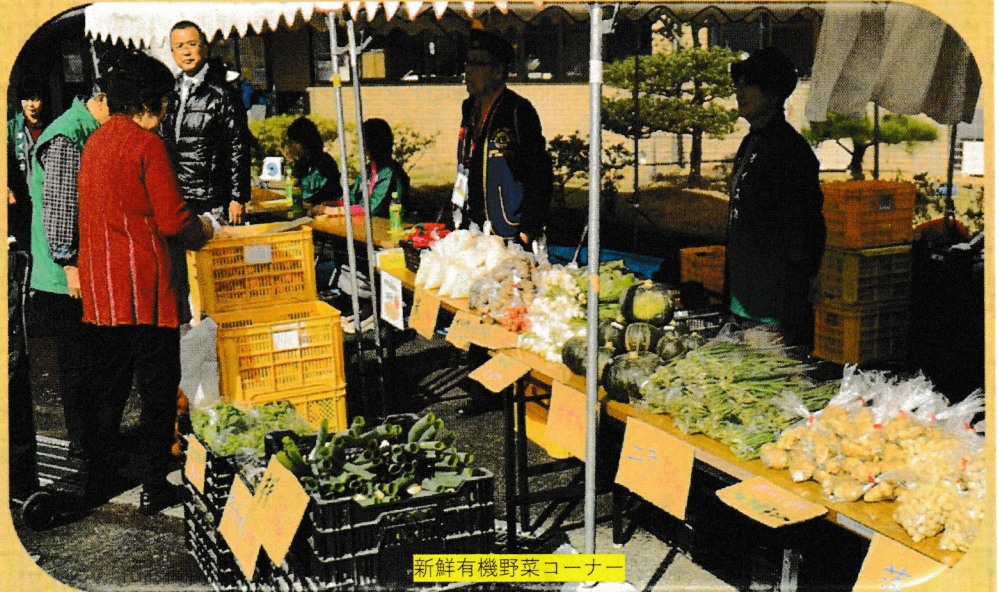
新鮮有機野菜コーナー