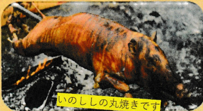
いのししの丸焼きです