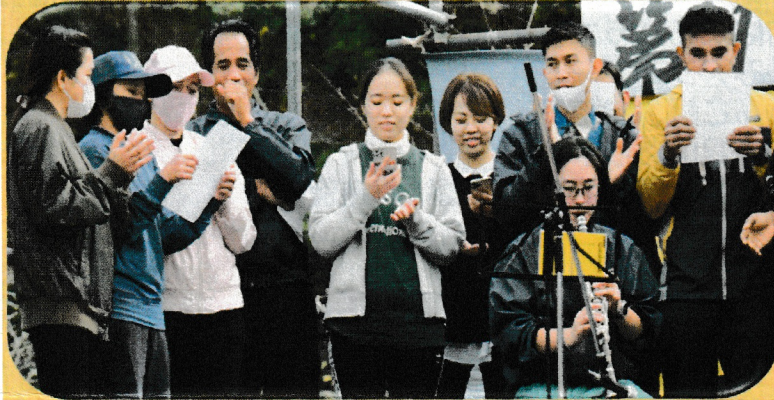
海外研修生の演奏